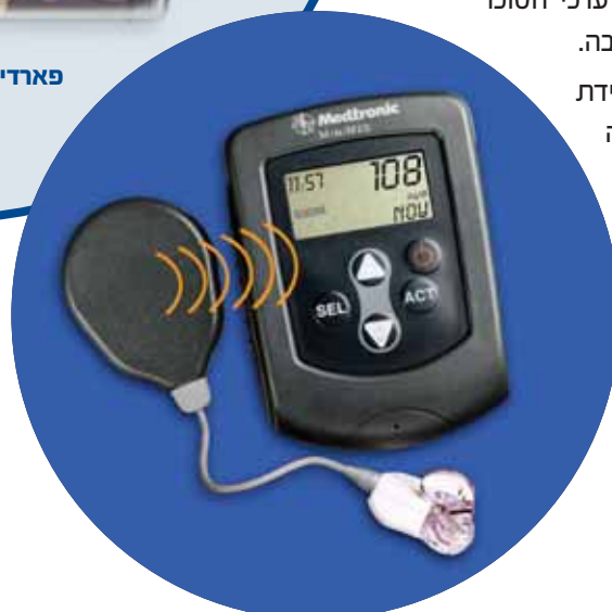
גרדיאן לקריאת סוכר רציפה