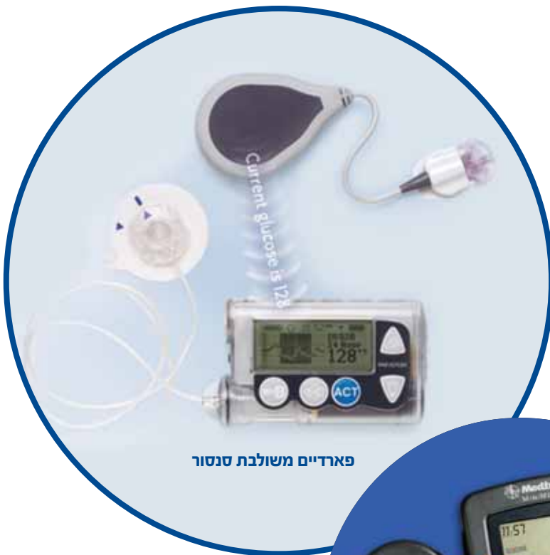
פארדיים משולבת סנסור

בזכות טכנולוגיה זו ניתן לקבל תמונת מצב עדכנית של ערכי הסוכר, להתאים את הטיפול הדרוש בזמן אמת, למנוע עליה או